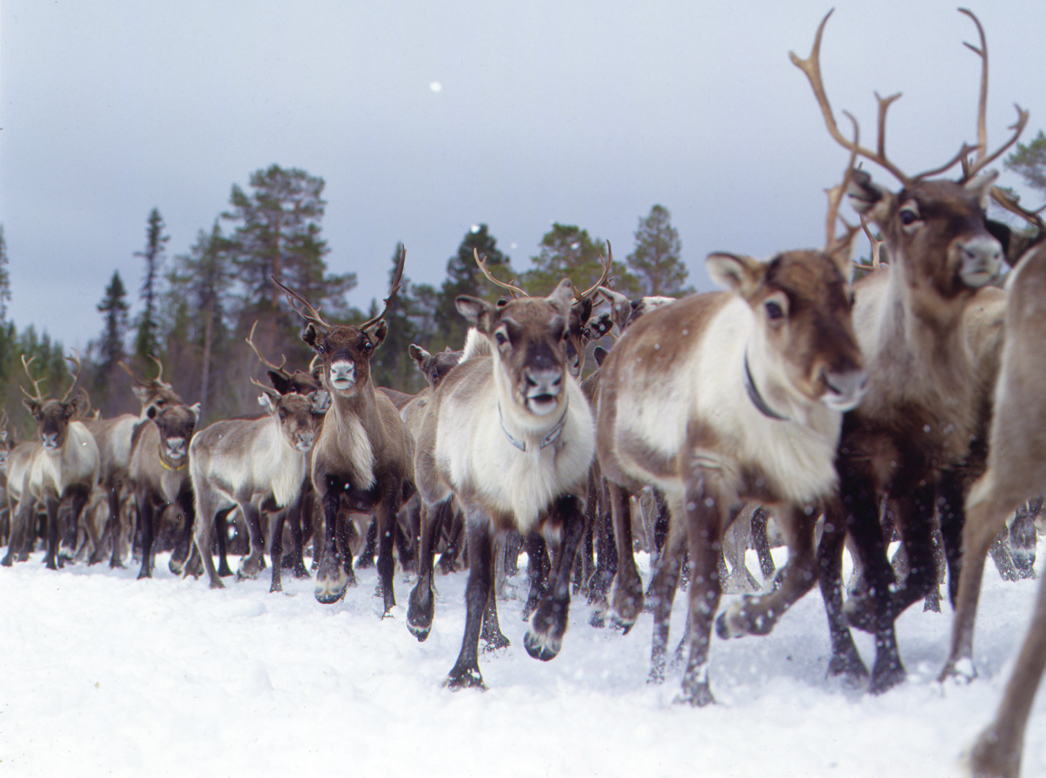
Renjord under flyttning.

På vintern äter renarna mest olika lavar. På sommaren äter de gräs, löv och olika växter.