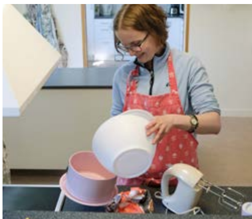
Bakning med flera ingredienser kan kopplas till fakta, förståelse, färdigheter och förtrogenhet.

– Till en början kändes det jobbigt att bli observerad av kollegor. Men det handlade ju inte om att de tittade på mig, utan om att se hur något görs i en situation och hur det