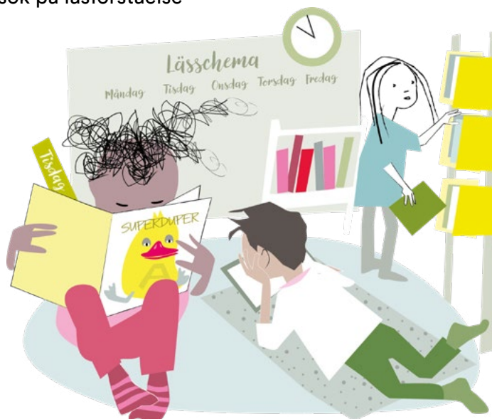
Illustration: Helena Halvarsson