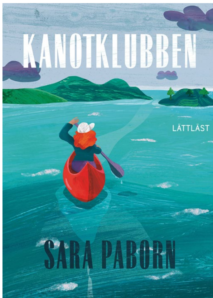
Illustration: LL-förlaget, Hanna Albrektsson

LL-förlagets webbplats www.ll-forlaget.se