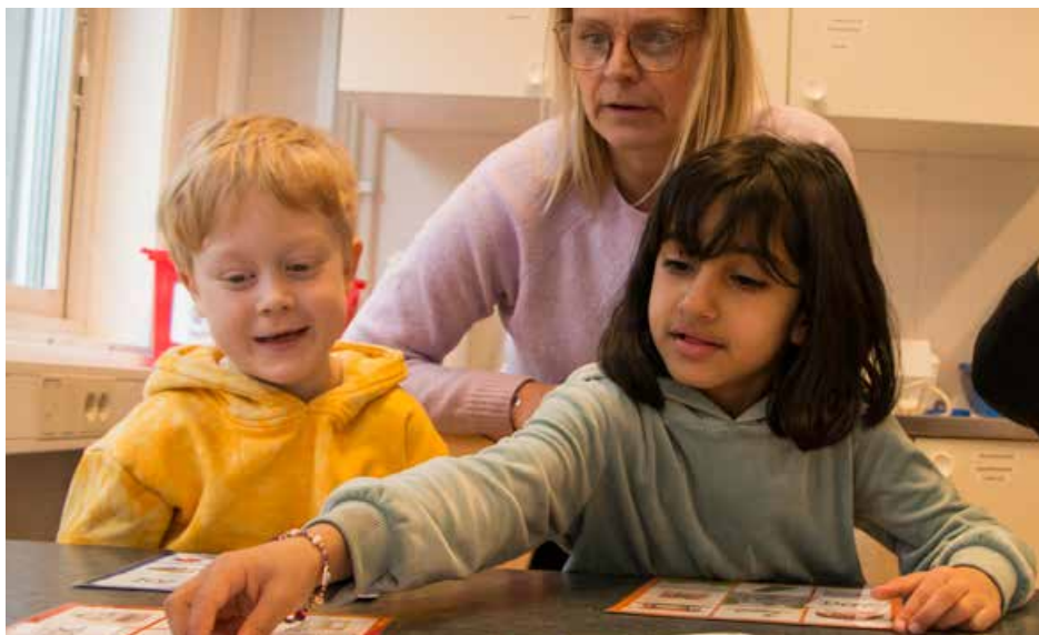
Eleverna i förskoleklassen tycker om att spela spel där de får koppla ihop ord och meningar med bilder. Mycket gör de på egen hand och de roterar vant mellan stationerna.

Sandvikskolan i Järfälla har fått bidrag från SPSM till att i projektform utveckla arbetet med lästräning i alla årskurser. Läs mer om möjligheten att få bidrag till utvecklingsprojekt på SPSM:s webbplats. www.spsm.se/bidrag-utvecklingsprojekt