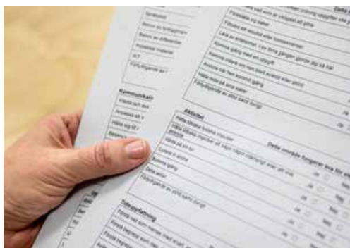
Dokumentet för övergångar består till stor del av kryssrutor, vilket gör att det går snabbt att fylla i.

Innehållet i Länka in tog projektgruppen fram själv med inspiration från liknande dokument som gymnasiesärskolan använt tidigare. De gjorde också ett Länka ut-dokument inför att eleven ska lämna gymnasieskolan. Då träffade de Försäkringskassan och Arbetsförmedlingen för att ta reda på vad som är viktigt för dem att få veta.