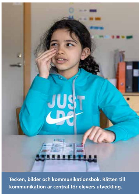
Tecken, bilder och kommunikationsbok. Rätten till kommunikation är central för elevers utveckling.