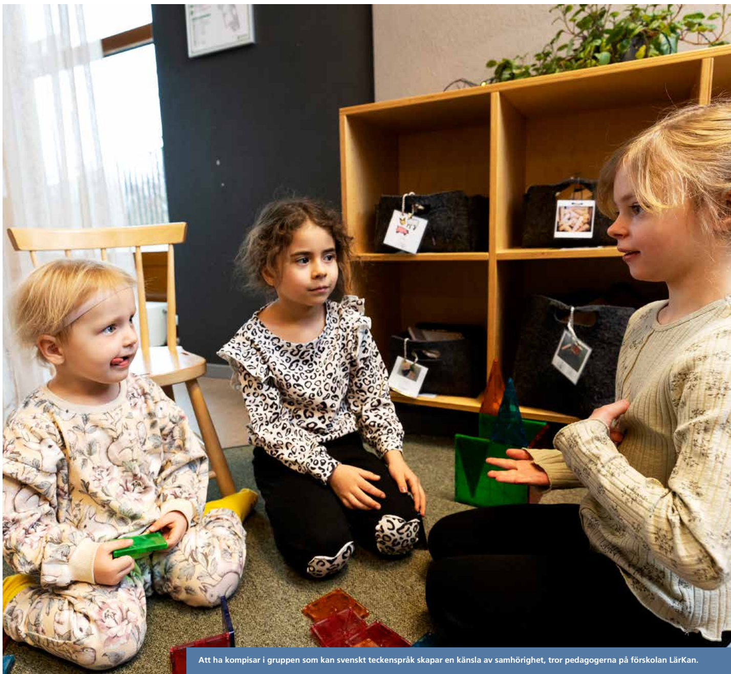
Att ha kompisar i gruppen som kan svenskt teckenspråk skapar en känsla av samhörighet, tror pedagogerna på förskolan LärKan.