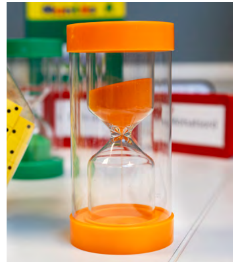
Ett timglas kan hjälpa till att hålla koll på tiden.