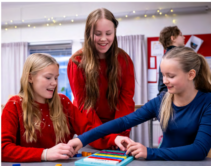
Under utbildningen pratar deltagarna om att matematiksvårigheter inte alltid behöver bero på dyskalkyli utan kan bero på till exempel språkliga förutsättningar, matematikrädsla och felinläring.