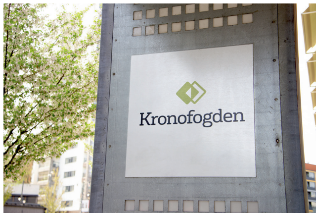
Kronofogden är en myndighet som arbetar med skulder.