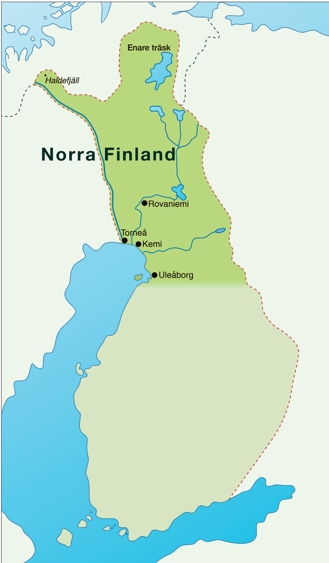
Karta över norra Finland.