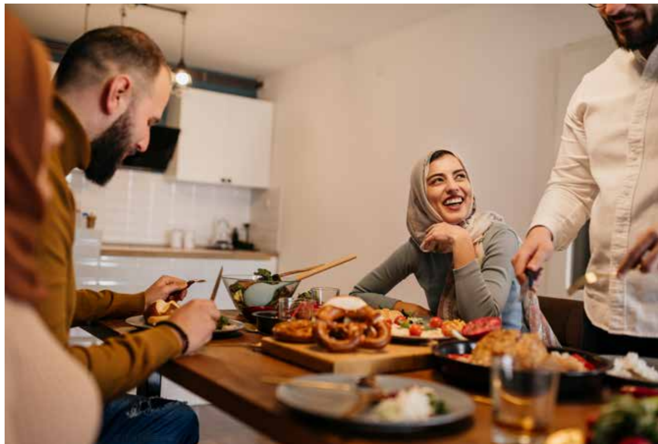
Kväll under ramadan. När solen gått ner äter och dricker muslimerna.