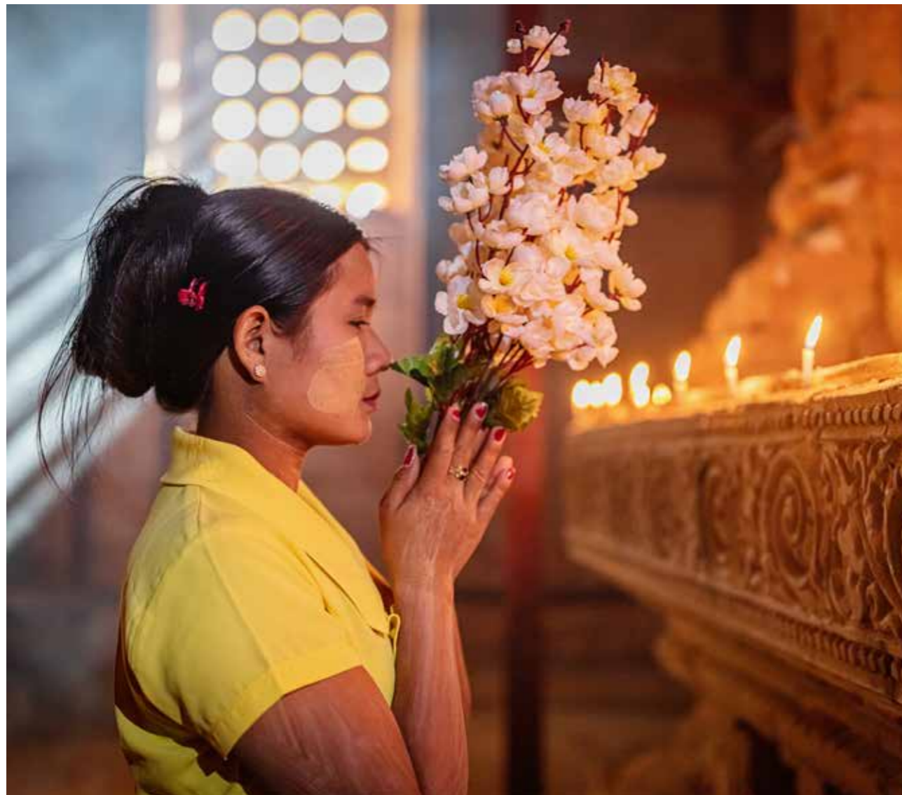
En buddhistisk kvinna ber.

En buddhist ska till exempel inte använda alkohol eller andra droger.