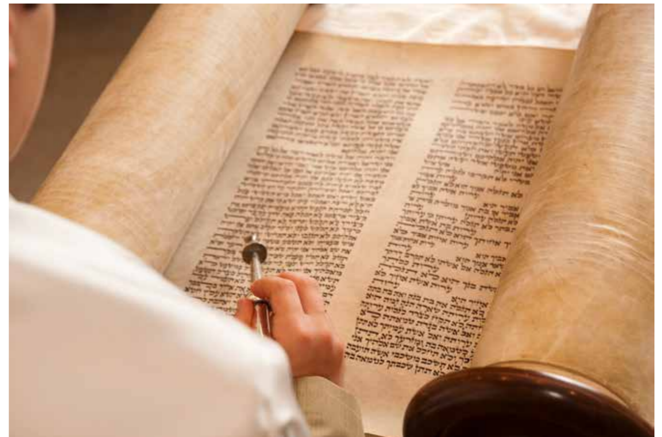
En ungdom läser i Tora.

I både böckerna står det hur judar ska vara mot andra människor.