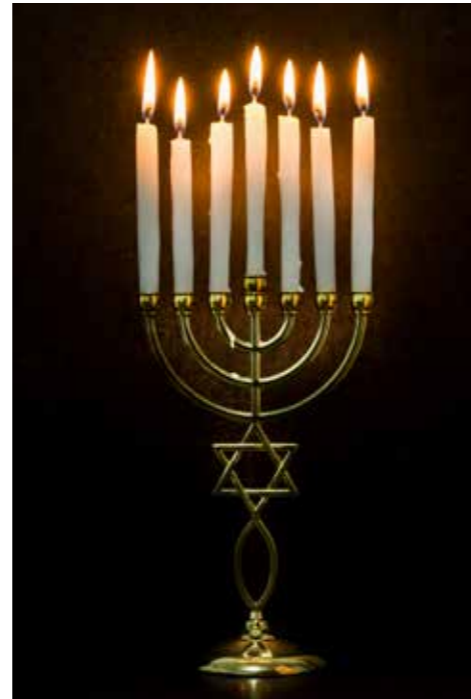
En menorah – en judisk ljusstake.

Sådant som vad man äter och hur man lagar maten kan vara väldigt viktigt inom judendomen.