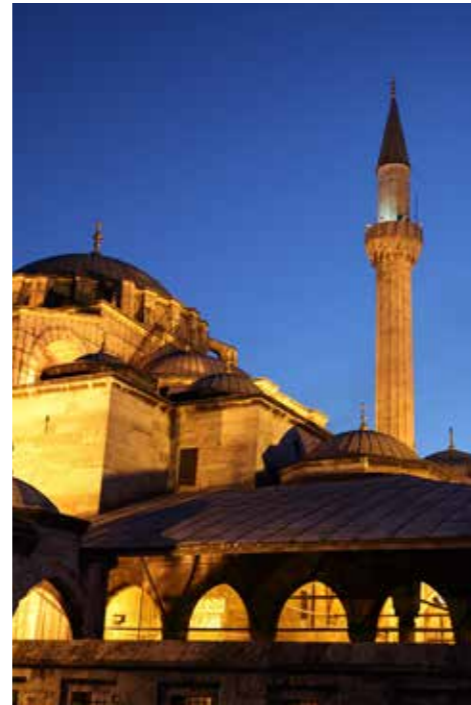
Många besöker moskén på natten under ramadan.

Muslimer fastar för att tänka på de som är fattiga och inte har så mycket mat.