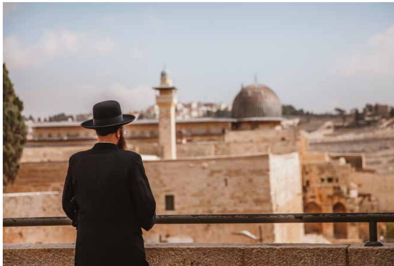
En judisk man i Jerusalem.