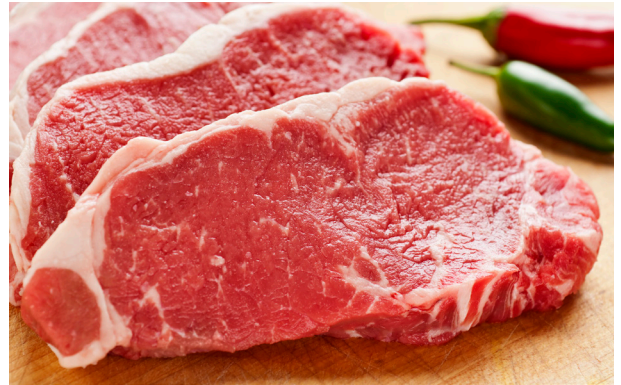
Kött är döda djur.

Vad tycker du? Är det rätt eller fel att döda djur för att vi ska få mat?