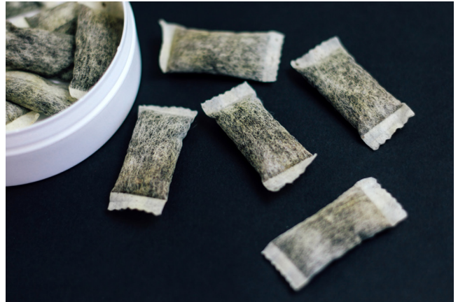
Snus är en sorts tobak.

Tycker du att det är rätt eller fel att vuxna får snusa och röka?