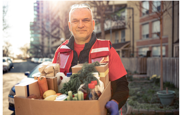
En man kör ut mat under covid-19-pandemin.

Kärlek kan man känna för många olika saker, till exempel för sin familj eller för ett husdjur.