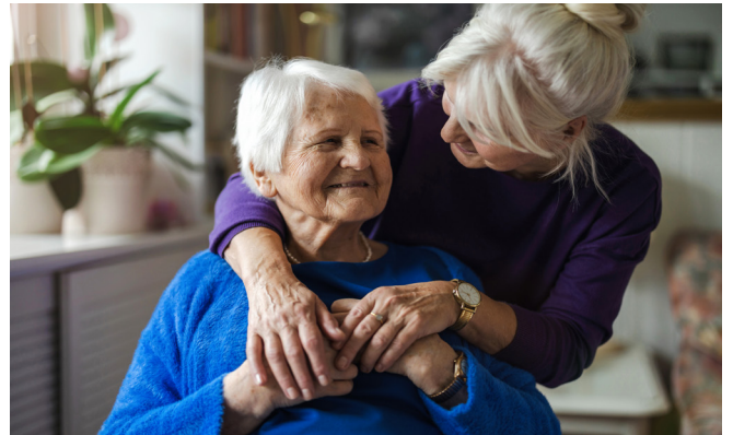
En gammal kvinna och hennes dotter.

Många vänner, en familj, ett arbete eller mycket pengar?