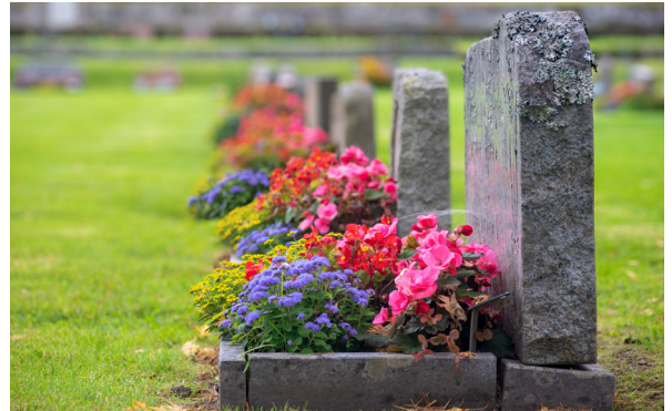
En rad med gravar.

I alla tider har människan tänkt på vad som händer efter döden.