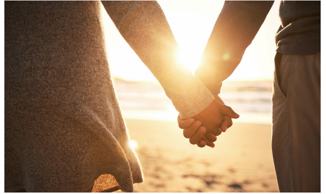
Ett par håller handen.

Kärlek kan man känna för många olika saker, till exempel för sin familj eller för ett husdjur.